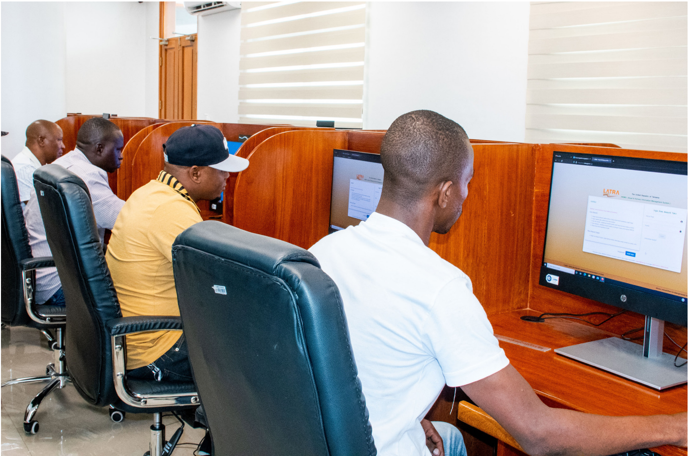
Baadhi ya madereva waliojitokeza kufanya mtihani wa kuthibitishwa kielektroni inayofanyika katika vyumba maalum vya mtihani Makao Makuu ya LATRA, Dar es Salaam